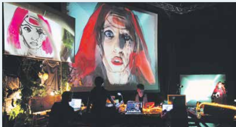
Neverjetno potovanje Rdeče kapice

Uvodni programski sklop, kot že nekaj let, namenjamo mladim občinstvom ter usposabljanju strokovnih delavcev v šolstvu in kulturi. Letos je tematsko usmerjen v umetniško refleksijo okolja in človekove odgo-