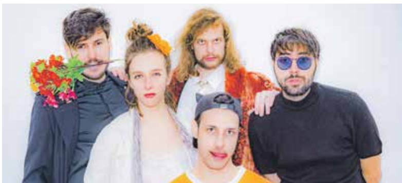
Skupina Insan