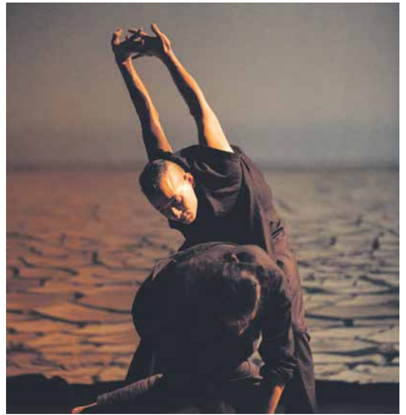
Sidi Larbi Cherkaoui, Nomad

Pusta pokrajina se sprva zdi kot prostor neomejene svobode, a prav v tej varljivi svobodi na »plešoče begunce« prežijo številne nevarnosti, ki na neki način spodbudijo in vzpostavijo duh človeške skupnosti, prijateljstva in sožitja. Sekvence Cherkaouijevega odprtega pristopa k telesu in kulturi, ki so temelj avtorjevega ustvarjalnega impulza, ter nehierarhične gibalne logike, ki se upira binarizmu moškega in ženskega principa, so v tej predstavi zasnovane na arabskih emblemih, kakršni