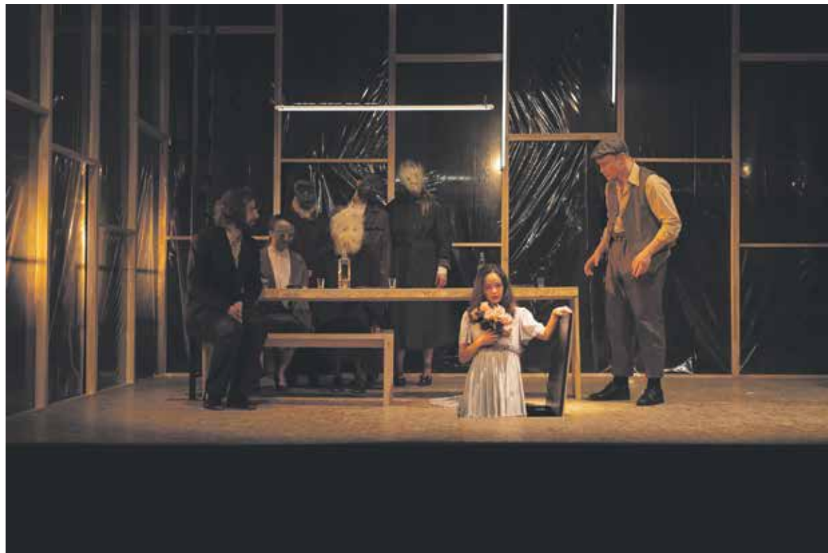
Strniševi Ljudožerci v izvedbi študentov UL AGRFT

Akademija za gledališče, film, radio in televizijo Univerze v Ljubljani predstavlja zrelo študijsko uprizoritev Strniševih Ljudožercev nekdanjega VII. semestra; igralci, režiserji in dramaturgi iz VIII. se-